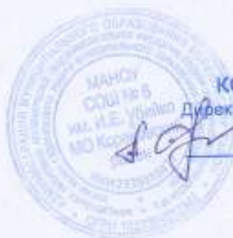
Д. С. Белобаба